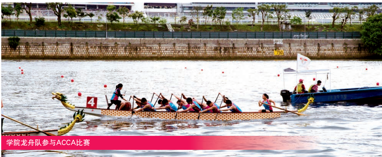
学院龙舟队参与ACCA比赛