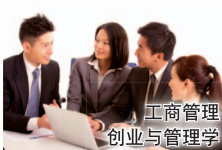
工商管理 创业与管理学