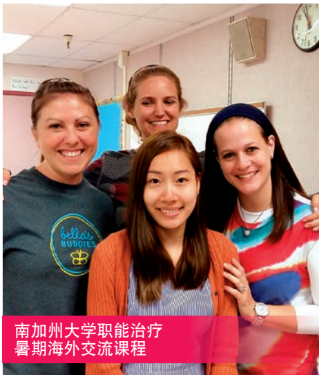
南加州大学职能治疗 暑期海外交流课程