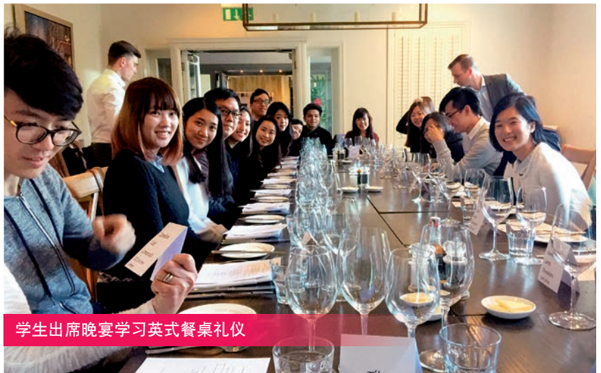
学生出席晚宴学习英式餐桌礼仪