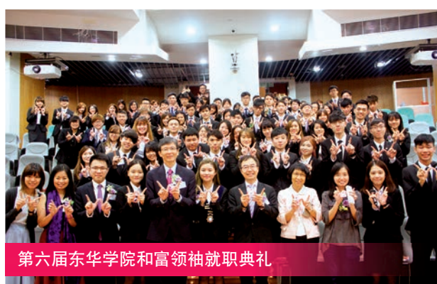
第六届东华学院和富领袖就职典礼