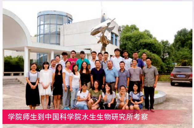
学院师生到中国科学院水生生物研究所考察