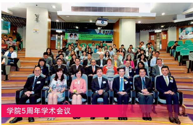
学院5周年学术会议