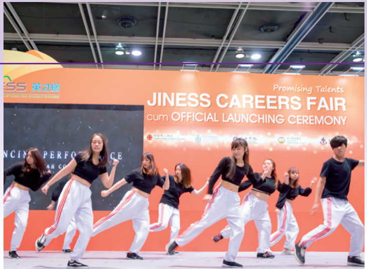
舞蹈学会学生表演