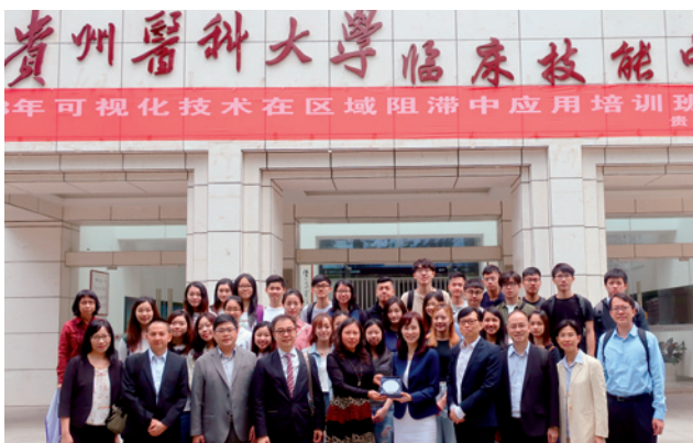
东华学院教职员参观贵州医科大学临床技能中心