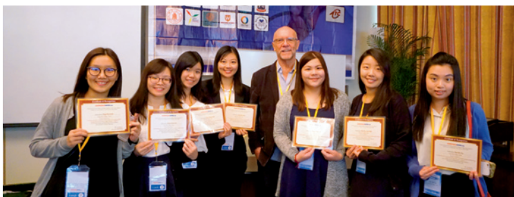
于日本参与国际护理学会议