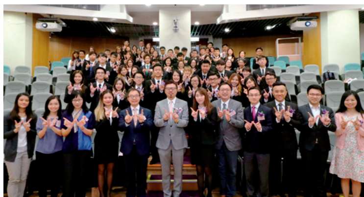
第七届东华学院和富就职典礼