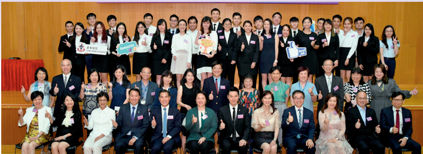
奖学金及奖项颁奖典礼